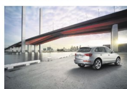
Ein kultivierter Begleiter für jeden Anlass: Ein Audi vom Audi Zentrum Hannover.