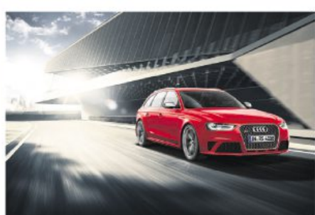
Immer an prominenter Stelle zu finden: Ein Audi vom Audi Zentrum Hannover.