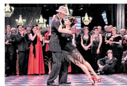
So tanzen Profis: Bei der Eröffnung zeigten Tänzer, dass Tango Leidenschaft mit Sportlichkeit verbindet.